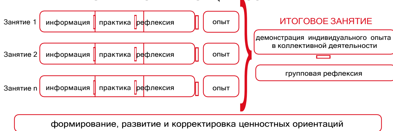
Рисунок 1 — Схема организации события

Таким образом, у пятиклассников происходит построение логической цепочки от собственного опыта проживания каждого занятия к ознакомлению с опытом других детей и к формированию общего отношения классного коллектива к прожитому ими событию.